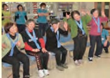
ジェスチャーゲーム