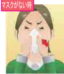
ティッシュやハンカチで口・鼻を覆う

ティッシュ：使ったらすぐにゴミ箱に捨てましょう ハンカチ：なるべく早く洗きましょう