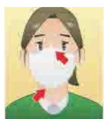
マスクを着用する（口・鼻を覆う）